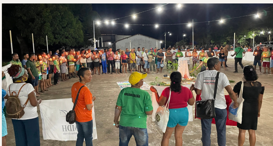
Celebração dos 40 anos de caminhada e luta

De 25 a 28 de julho de 2024, a Animação dos Cristãos no Meio Rural (ACR do Munim), a Associação Agroecológica TIJUPÁ, a SMDH, a Igreja Católica de Morros e Cachoeira Grande, e as Comunidades Eclesiais de Base (CEBs) realizaram o 40º Encontro de Lavradores e Lavradoras do Baixo Munim, na Comunidade de Santo Antônio do Napoleão, em Cachoeira Grande. O tema do encontro foi "Semente Viva no Campo!", com o lema "Gerando Conhecimento, Resistência, Fraternidade e Direitos na Comunidade". O evento reuniu aproximadamente 300 participantes.